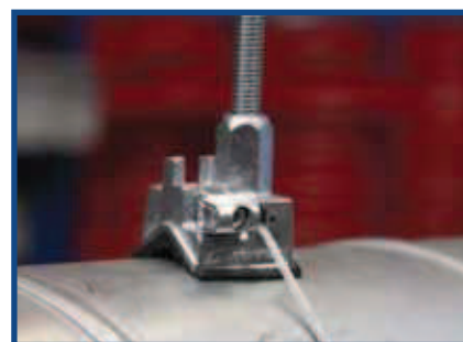
Conduto Spiro de 125 mm de Diâmetro