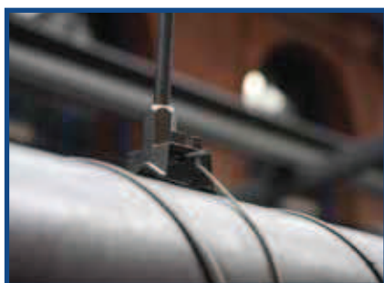
Conduto Spiro de 250 mm de Diâmetro