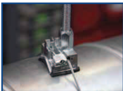
Conduto Spiro de 315 mm de Diâmetro